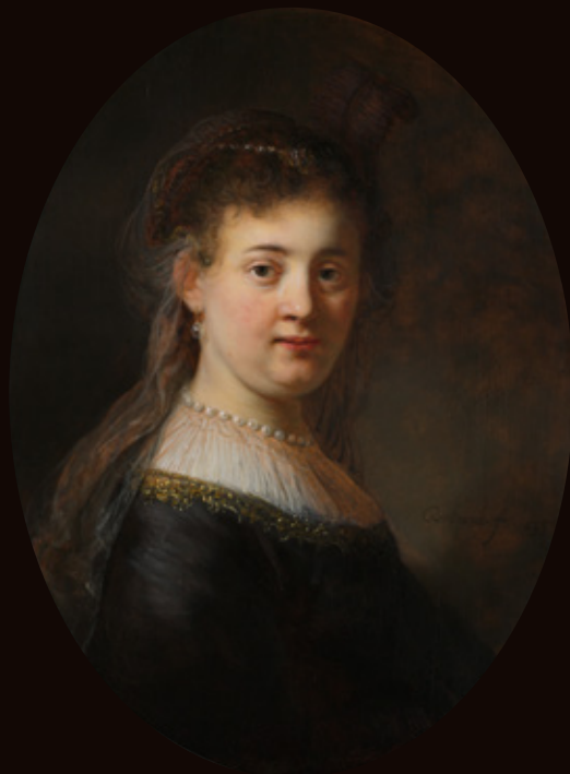
Jonge vrouw in gefantaseerde kleding Rembrandt 1633. Olieverf op paneel, 65 x 48 cm RIJKSMUSEUM, AMSTERDAM

Geschonken door de Vereniging Rembrandt (dankzij een schenking van de heer en mevrouw De Bruijn-van der Leeuw ter gelegenheid van het 50-jarige bestaan van de Vereniging Rembrandt, voor plaatsing in het Rijksmuseum), 1933